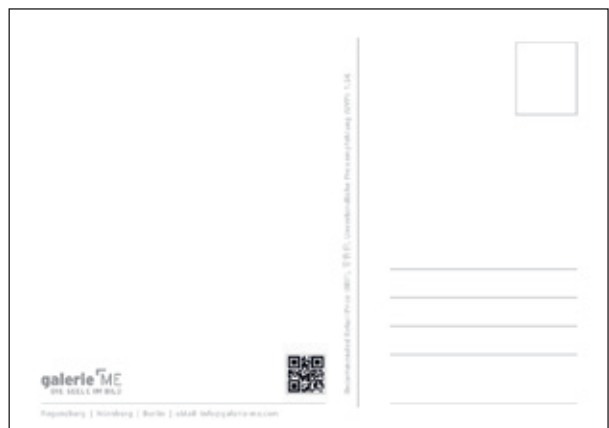
Trauermotiv 6 #TE13006