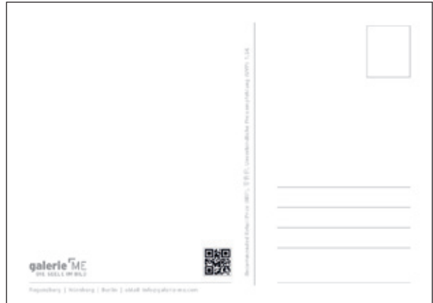
Trauermotiv 17 #TE13017