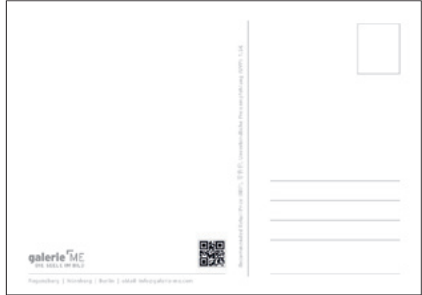
Geburtstagsmotiv 8 #GE13008